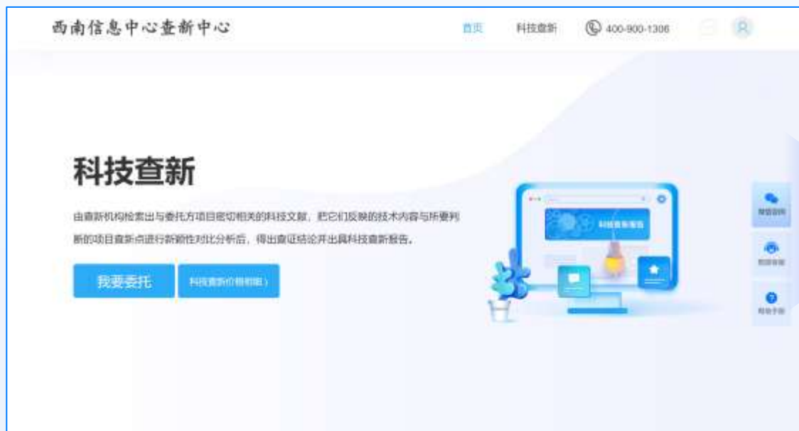
科技查新服务首页