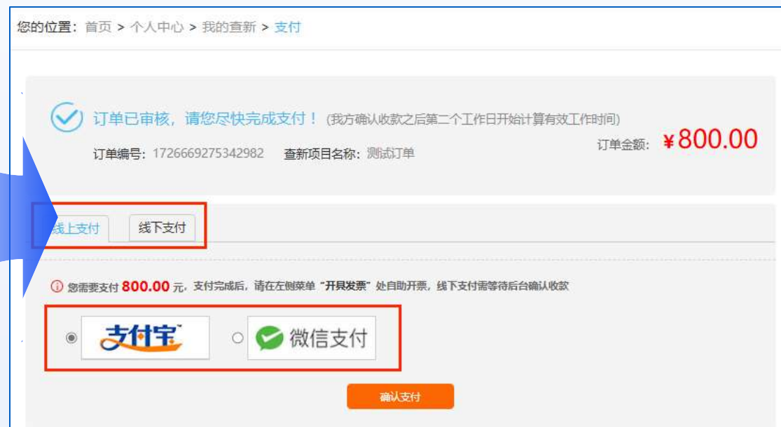
科技查新支付方式